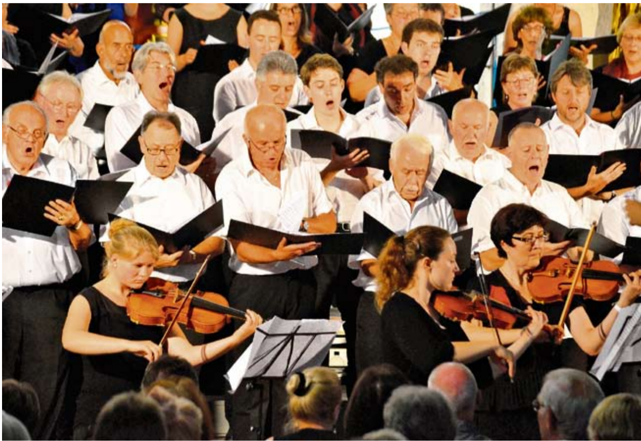
Zum Abschluss der Abend-Sing-Woche in Jestetten trat ein 80-köpfiger Chor in der katholischen Kirche auf.